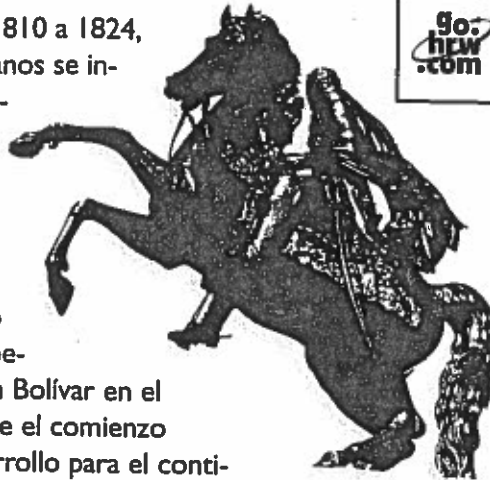
◀ Simón Bolívar, héroe de la independencia sudamericana

El proceso de independencia De 1810 a 1824, la mayoría de los países hispanoamericanos se independizaron de España, gracias al debilitamiento del poder español y la influencia del nacionalismo traído por la independencia de Estados Unidos y la Revolución francesa. En México, la guerra empezó con el famoso grito de independencia del padre Miguel Hidalgo y Costilla en 1810. En Sudamérica, la liberación se logró bajo el mando de Simón Bolívar en el norte y José de San Martín en el sur. Fue el comienzo de una nueva era de cambios y de desarrollo para el continente americano.