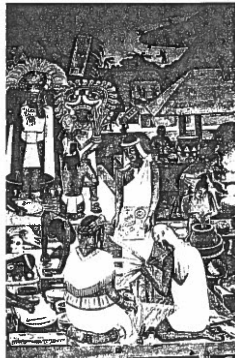
Mural «Historia de México» en el Palacio Nacional de la Ciudad de México ▶

Diego Rivera (1886–1957) , en uno de sus proyectos más ambiciosos, representa la historia de México desde la caída de Teotihuacán hasta el comienzo de la presidencia de Cárdenas en 1935. Rivera divide el retrato de la historia en dos partes, de la civilización prehispánica a la conquista y de la conquista hacia el futuro, todo visto desde una perspectiva social revolucionaria. En esta sección del mural, Rivera presenta una versión mitológica de la vida de los indígenas, su religión y sus costumbres.